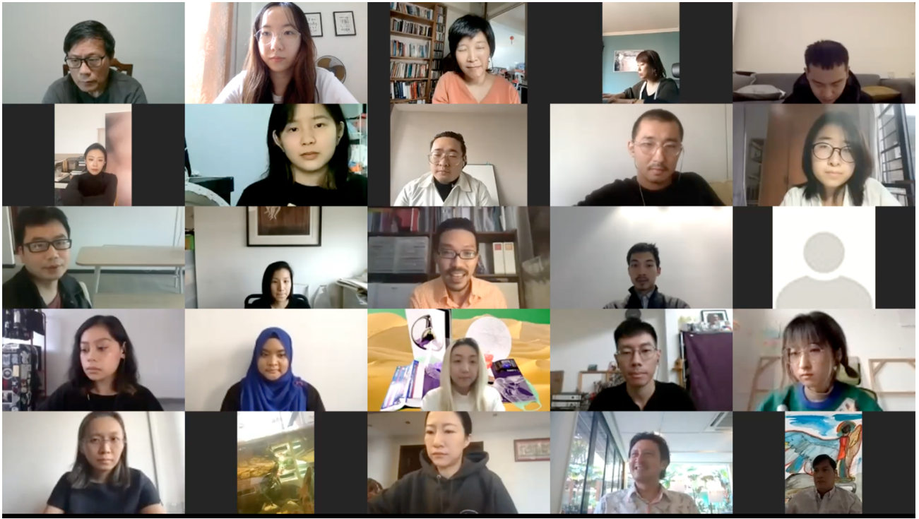
Figure 4. 每对艺术家在2021年2月9日向由4位导师组成的小组分享他们的作品, 以获得宝贵的反馈意见, 以便在2021年2月26日进行最终的艺术作品展示。

- 纪录片 :由著名的新加坡导演Tan Siok Siok陈惜惜女士执导, 主题为“友谊2050”。她在中国生活了十年, 曾出色的执导过影片《北京: 城与年》。ARTX30纪录片讲述的是艺术家们在创作过程中的经历和故事, 展示艺术如何以令人惊讶的方式与社会和文化相交, 并反思艺术在动荡和快速变化的世界中的角色。