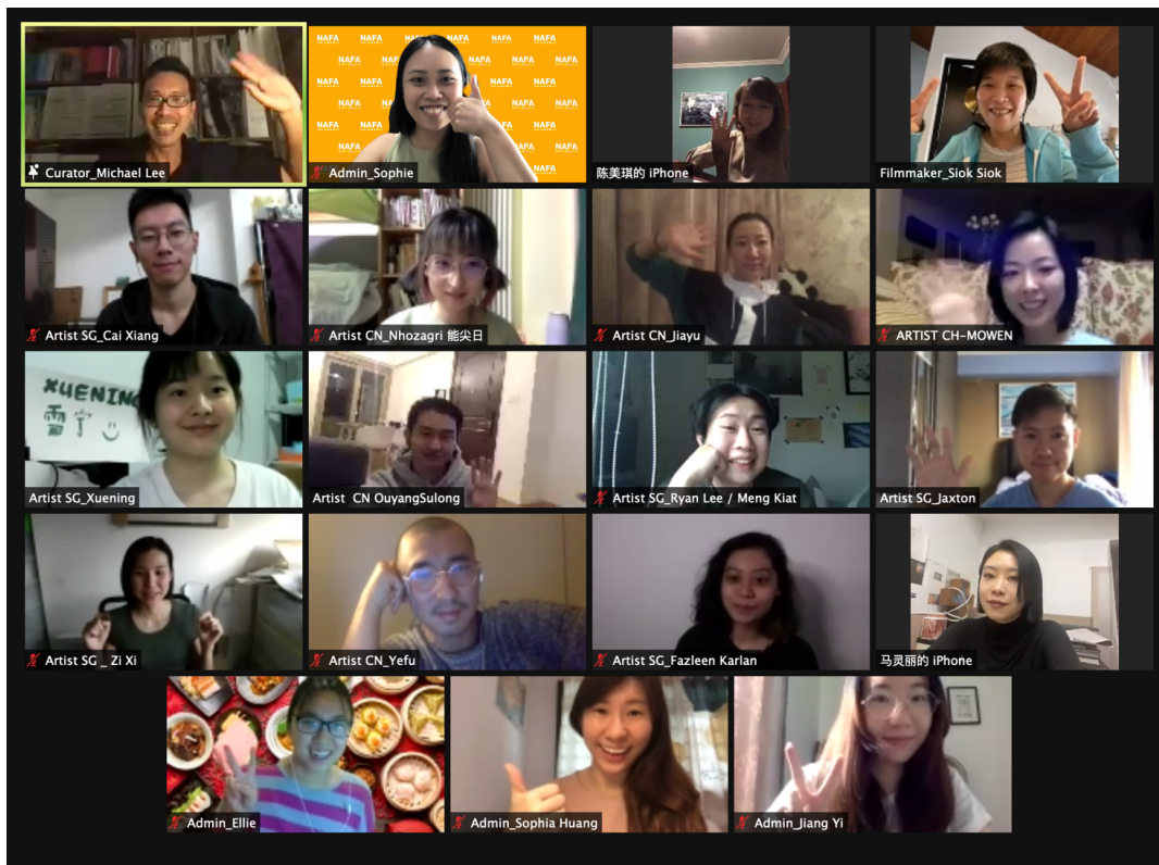
Figure 1. 两国艺术家于2021年1月18日通过Zoom进行“速配”，以选择理想的合作对象。